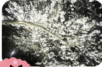
満開の桜 桜の下でニコッと 集合写真▶